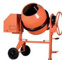
BP 200 D TD