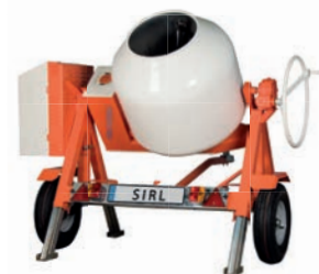
B 400 S RLAT